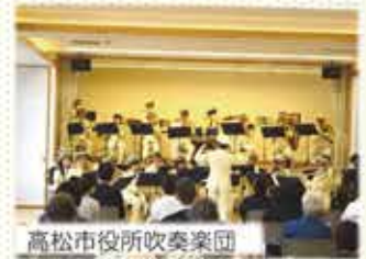
高松市役所吹奏楽団