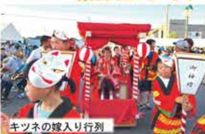
キツネの嫁入り行列

今年は大変多くの方にご来場いただきました。ステージイベントにバザーと会場は大盛況。子どもたちの溢れる笑顔が印象的でした。また夏の夜空に輝く大輪の花火に大歓声があがりました！ご来場いただいた皆さま、安全確保にご協力いただき、ありがとうございました。