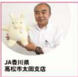
JA香川県 高松市太田支店

令和5年度9月より、「地域のためになることを行うことも仕事の一つ」と地域企業の方々がパトロールカー乗車に参加されています。このような企業様のご参加も大歓迎です。お問い合わせ、お待ちしております。