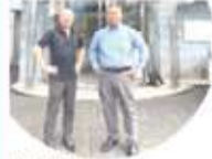
有限会社 エーワンセキュリティ サービス

令和5年度9月より、「地域のためになることを行うことも仕事の一つ」と地域企業の方々がパトロールカー乗車に参加されています。このような企業様のご参加も大歓迎です。お問い合わせ、お待ちしております。