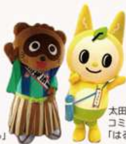
太田南地区 コミキャラ 「ゴンタくん」