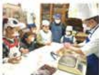
協力：お菓子のわかくさ

専門の和菓子店での手作り体験は、今年も大人気。練った皮を広げ、餡を入れて丸めます。かわいい手のひらで3つ4つと作っていくと、何とか形もだ円形になりました。子どもたちは、蒸したての讃岐名物平太夫饅頭を手にニコニコ顔でした。